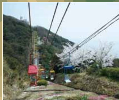
観光リフトと回転展望閣