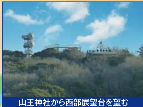
山王神社から西部展望台を望む