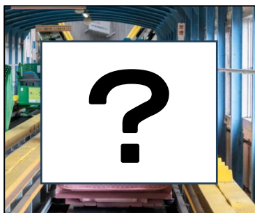
60 周年記念カーレーター

60 周年を記念し、3 月 18 日（水）～5 月 31 日（日）の間、赤いちゃんちゃんこをまとった記念カーレーター 2 台を設置します。また、期間中は係員も記念ハッピーを着用してお祝いムードを盛り上げます。