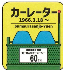
記念マグネット・ステッカー