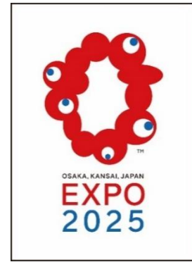
ラッピング列車正面、ヘッドマーク、ドア横ステッカーイメージ