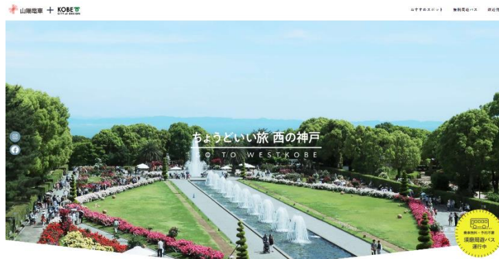
特設ホームページ