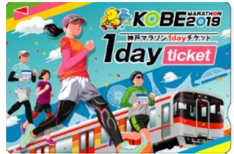
「神戸マラソン 1day チケット」券面

「神戸マラソン EXPO 2019」会場（11月15日（金）・16日（土）のみ）