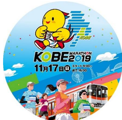
『神戸マラソン』PRヘッドマーク