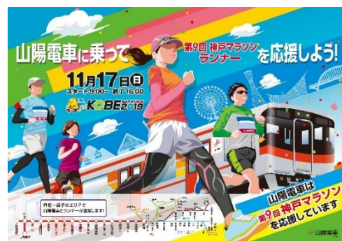
『神戸マラソン』山陽電車メインビジュアル