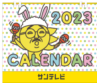
サンテレビオリジナルカレンダー