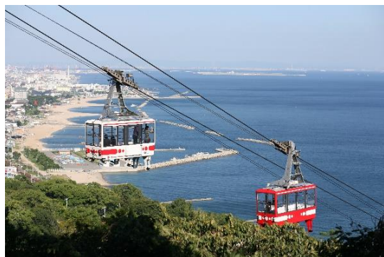
須磨浦山上遊園ロープウェイ

●須磨浦山上遊園のロープウェイ（往復）、カーレーター（往復）、回転展望閣（入場券）および観光リフト（往復）が無料でご利用いただけます（2023年3月31日まで有効）。