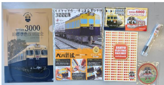
山陽電車ノベルティグッズ詰め合わせ