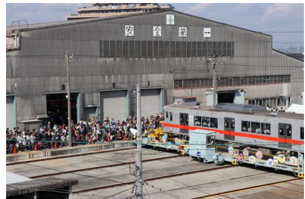
トラバーサー走行実演