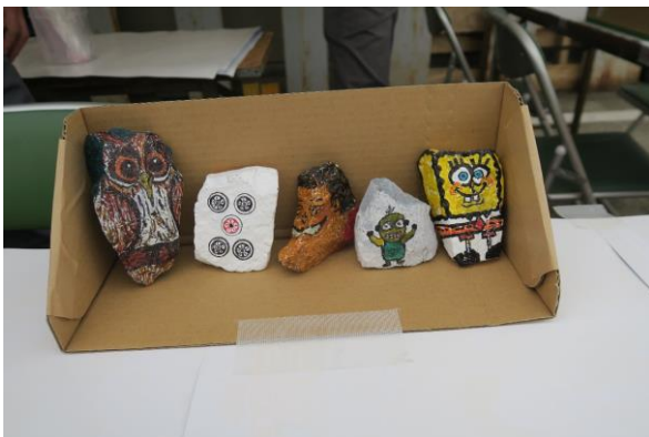
砕石への絵描き体験