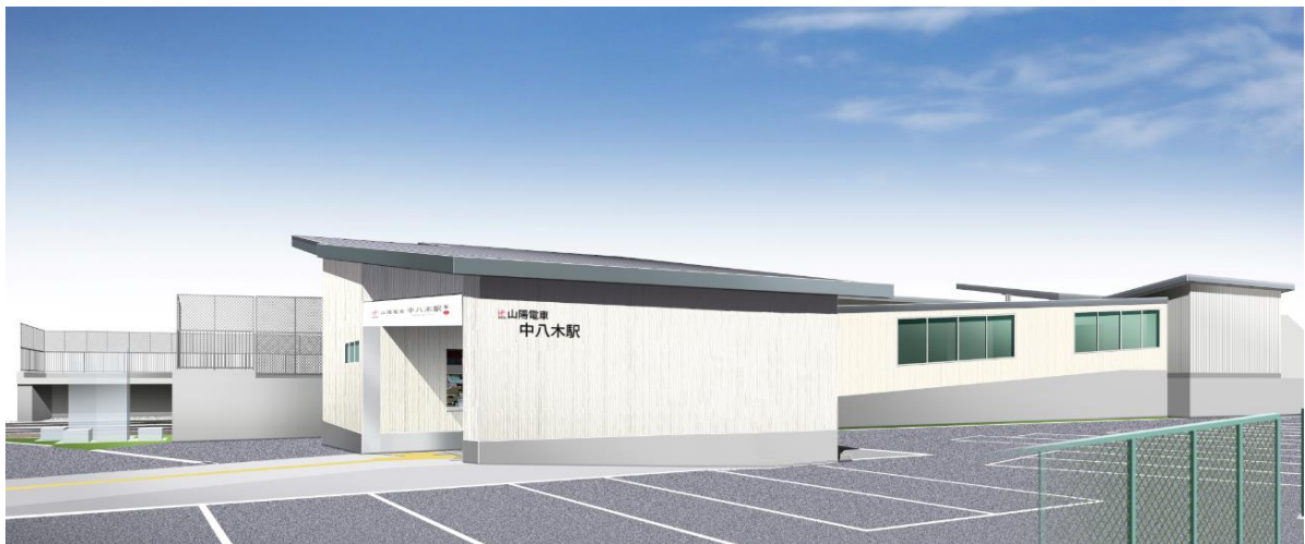
中八木駅北側のイメージ

上り・下り各ホームと車両床面との段差縮小工事は、3月5日（土）に完了しています。