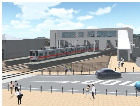
駅北側のイメージ