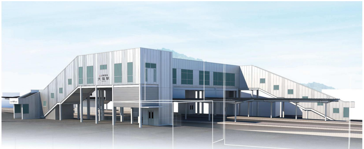
駅南側のイメージ