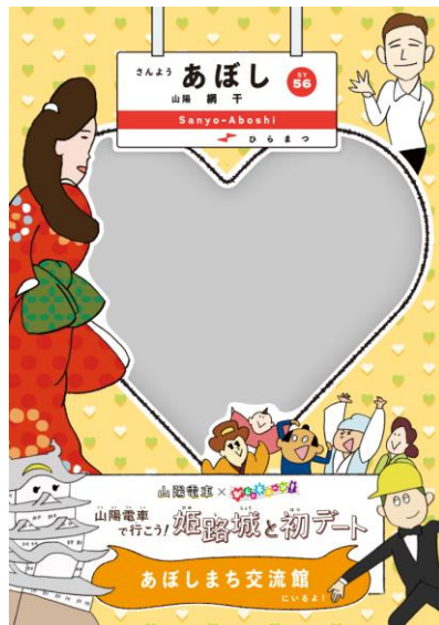
<あぼしまち交流館>