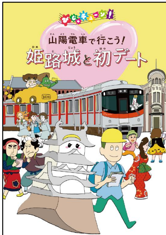
本イベントのメインビジュアル

※この取組みは、観光庁「既存観光拠点再生・高付加価値化推進事業」の採択を受け、公益社団法人姫路観光コンベンションビューローのほか、地域の交通事業者をはじめ多様な観光事業者と連携し、「てーてって! 姫路まんきつ観光キャンペーン」と銘打ち、2021年秋・冬に実施する誘客促進事業の内の1つです。