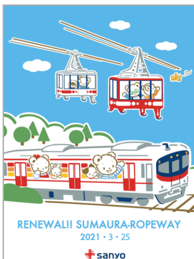
ドア横ステッカー