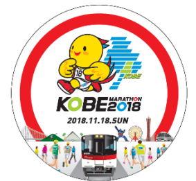
『神戸マラソン』PRヘッドマーク