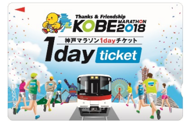
「神戸マラソン1day チケット」券面