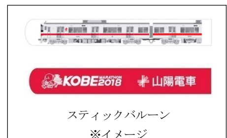
スティックバルーン