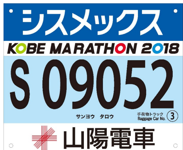
「山陽電車」のロゴ入りナンバーカード