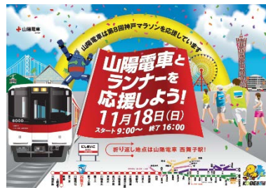
『神戸マラソン』PRポスター