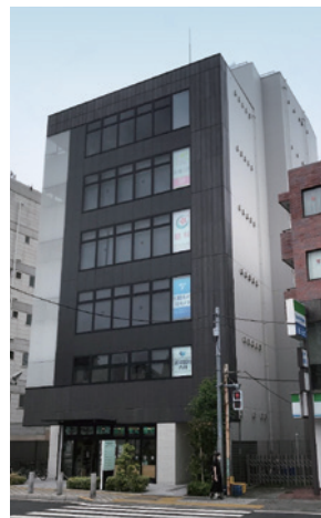
クリニックビル(東京都世田谷区)