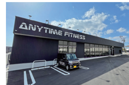
エニタイムフィットネス学園南店

昨今の健康志向の高まりを受け、神戸市垂水区に新規事業のスポーツジム「エニタイムフィットネス学園南店」を2022年4月1日にオープンしました。エニタイムフィットネスは、24時間年中無休でご利用いただけるマシンジム特化型で、国内では1,000店舗以上を展開、世界全店で相互利用可能となっております。