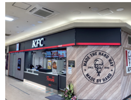
ケンタッキー・フライド・チキン イオンジェームス山店

「ケンタッキー・フライド・チキン 垂水店」および「ケンタッキー・フライド・チキン イオンジェームス山店」など、計画的に既存店舗のリニューアル工事を進めております。今後も地域の皆さまに喜んでいただける店舗づくりに取り組むとともに、テイクアウト需要の取り込みなどにも注力し収益拡大をはかってまいります。