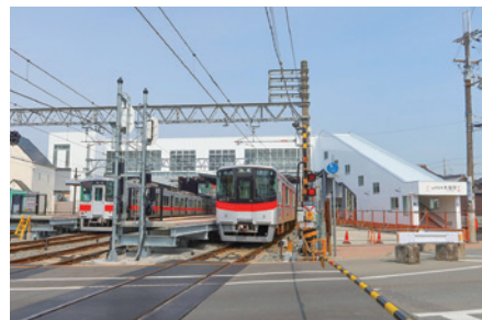
新たに橋上駅となった大塩駅

姫路市と連携して進めていました大塩駅改良工事では、駅部の工事が完了し、橋上駅舎化にあわせてエレベーターを改札内外に整備するとともに、多機能トイレを新設しました。また、ホーム延伸により上り6両編成列車最後尾車両の扉を乗降可能とし、より安全・快適にご利用いただけるようになりました。そのほか、駅南側駅前広場整備および周辺道路整備が姫路市事業として進められており、駅周辺もあわせて利便性が大きく向上します。