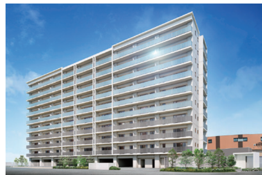
リアラス明石西新町

明石市において、分譲マンション「リアラス明石西新町」の建設・販売を進めています。西新町駅から徒歩1分に位置する本マンションは、徒歩圏内に商業施設、医療施設、教育機関があることに加えて、1駅2分の山陽明石駅周辺へも近く生活に便利な立地にあります。全戸南向きで、高層階からは瀬戸内海と淡路島が一望できます。