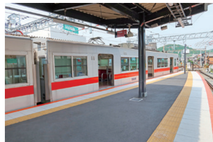
延伸した大塩駅上りホーム