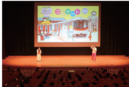
「びじゅチューン！」コンサート