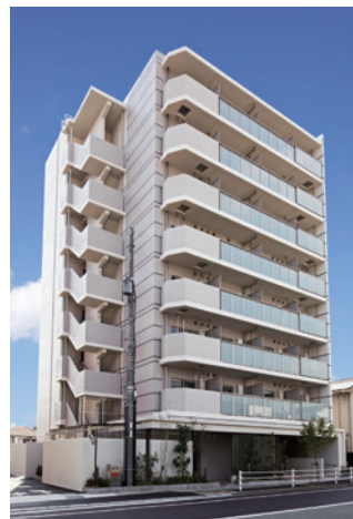
エス・キュート パル 神戸御影