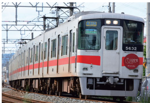
シゴセンゴー「レッド」

運輸業全体の営業収益につきましては、前年よりも出控えによる影響が小さかったほか、沿線学校の臨時休校が実施されなかったことなどにより、7,844百万円（前年同期営業収益は7,293百万円）となりました。