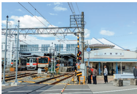
改良工事中の大塩駅