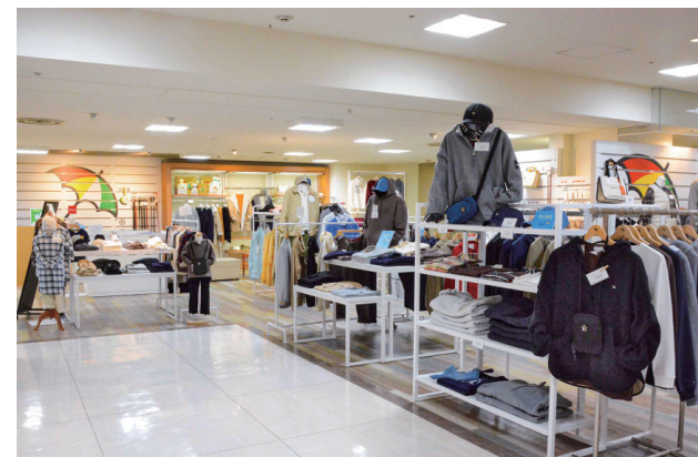
アーノルドパーマー