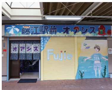
藤江駅前オアシス