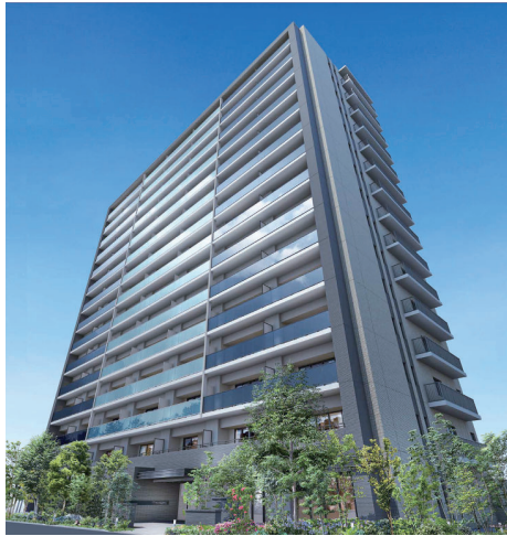
ブランシエラ加古川リアラス

不動産業のうち分譲事業におきましては、神戸市西区での分譲マンション「クレヴィアシティ西神中央」の建設・販売を、加古川市での分譲マンション「ブランシエラ加古川リアラス」の建設を推進しました。賃貸事業におきましては、神戸市東灘区での学生向け賃貸マンション「エス・キュートパル神戸御影」の建設を引き続き進めたほか、神戸市須磨区で新たに保育園を誘致するなど、さらなる収益基盤の拡充に注力しました。