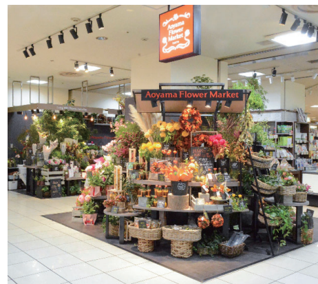
青山フラワーマーケット

流通業全体の営業収益につきましては、新型コロナウイルス感染症の感染拡大防止のため、山陽百貨店では一部売場の臨時休業や時短営業を行ったものの、前年よりも実施期間が短かったことなどにより来店客数の回復が見られた一方で、収益認識に関する会計基準等の適用の影響を受け、3,942百万円（前年同期営業収益は7,639百万円）となりました。