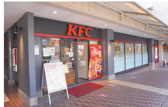
ケンタッキー・フライド・チキン名谷店

レジャー・サービス業におきましては、ゴルフ練習場「サン神戸ゴルフガーデン」の利用者が増加したほか、ケンタッキー・フライド・チキンおよびミスタードーナツの各店舗でテイクアウト需要を取り込めたことにより、営業収益は984百万円（前年同期営業収益は890百万円）となりました。