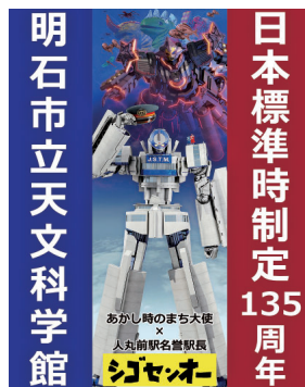
ドア横ステッカー