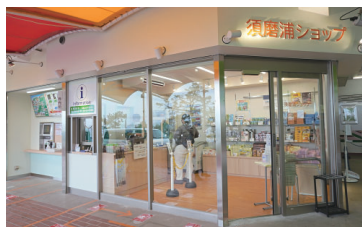
山麓売店「須磨浦ショップ」

須磨浦山上遊園では、2020年11月から進めていたロープウェイのリニューアル工事が完成し、3月25日に全面営業再開しました。本工事では、運転方式を手動式から自動式へ変更したほか、原動装置等の各種設備を更新し、さらなる安全性の向上をはかりました。あわせてリニューアルした山麓売店「須磨浦ショップ」では、オリジナル商品を中心に品ぞろえを充実しました。また、ファミリアとのコラボレーション企画を実施し、ヘッドマーク等の掲出やコラボレーショングッズの販売により、ご好評をいただきました。