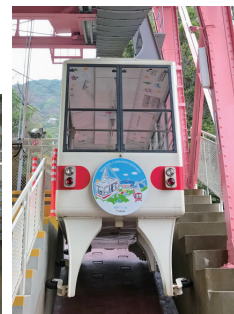
須磨浦ロープウェイ