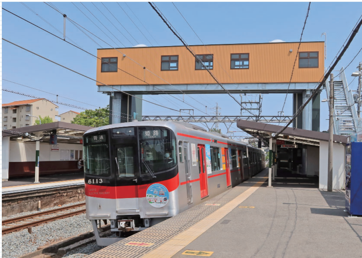
バリアフリー化した林崎松江海岸駅