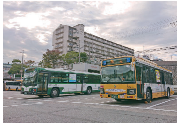
並ぶ山陽バスと神戸市バス

山陽バスにおきましては、神戸市バスの一部路線の運行・車両整備およびその管理等を受託しました。今後、さらなる受託の拡充により事業基盤の強化をはかってまいります。