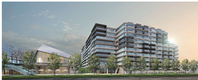
クレヴィアシティ西神中央

神戸市西区において、分譲マンション「クレヴィアシティ西神中央」の建設を進めております。本マンションは神戸市の市有地における西神中央文化・芸術ホール等整備事業の公募に当選した事業として建設するものであり、隣接地には文化・芸術ホールと図書館が一体的に整備されます。マンションギャラリーもオープンしており、引き続き販売活動にも注力してまいります。