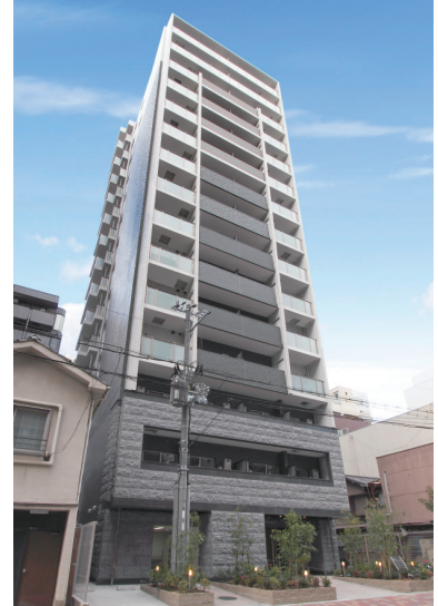
エス・キュート京町堀

大阪市西区にて賃貸マンション「エス・キュート京町堀」を取得しました。本マンションは、梅田や難波・心斎橋へのアクセスが良く、オフィス街である本町へも徒歩圏に位置しています。今後も当社沿線や京阪神地区・首都圏において新たな収益不動産を取得し、事業基盤のさらなる拡充に努めてまいります。