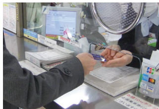
クレジットカード決済

定期券発売所にクレジットカード決済端末を導入しました。定期券購入時のお支払いで主要なクレジットカードによる決済が可能となり、お客さまの利便性向上をはかりました。