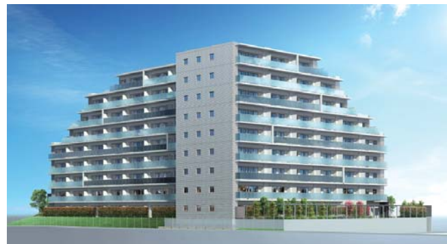
リアラス東加古川

加古川市平岡町において、分譲マンション「リアラス東加古川」の建設・販売を進めています。本マンションは別府駅自転車8分、JR東加古川駅徒歩11分に位置し、2線2駅の利用が可能な交通至便な立地です。スーパーマーケットが隣接しているほか、近隣には大型商業施設をはじめ教育機関や医療施設などの生活施設が充実しており、便利で暮らしやすいエリアです。