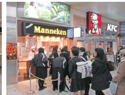
マネケン山陽明石駅店