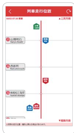
列車走行位置画面