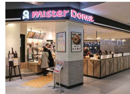
ミスタードーナツテラッソ姫路ショップ

飲食業を営む山商では、「ミスタードーナツテラッソ姫路ショップ」と、焼きたてベルギーワッフルを販売する「マネケン山陽明石駅店」を新たにオープンしました。既存店舗のリニューアルも実施するなかで、飲食業のさらなる拡大をはかってまいります。