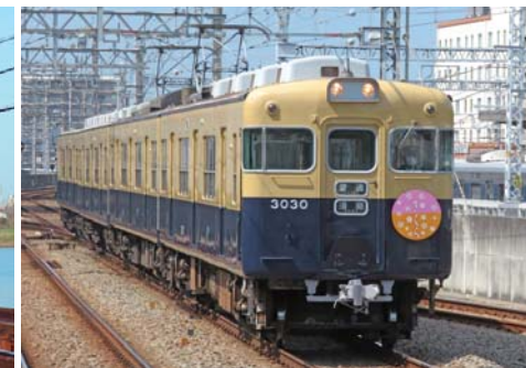
3000系ツートンカラー復刻車両