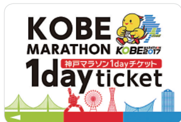
「神戸マラソン 1 dayチケット」