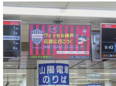
情報ディスプレイによる告知