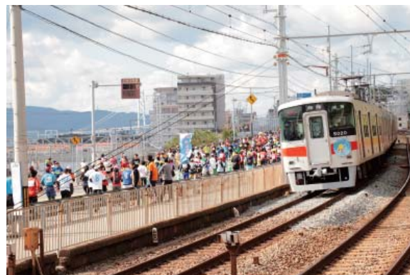
神戸マラソンヘッドマーク車両の運行