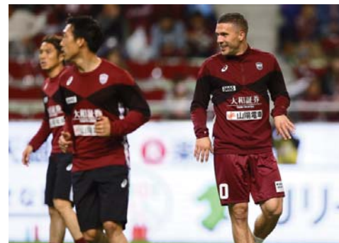
©VISSEL KOBE ウォームアップウェアにロゴ掲出