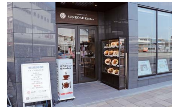
SUNROAD Kitchen 西明石店

タクシー業だけでなく、山陽そばをはじめ飲食業も営む大阪山陽タクシーでは、新しいカフェの店舗として、JR西明石駅前のホテル1階に「SUNROAD Kitchen 西明石店」を、山陽垂水駅高架下に「SUNROAD Light 垂水店」をオープンしました。