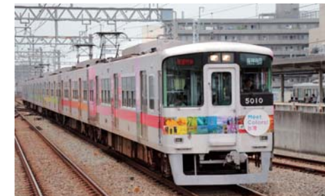
「Meet Colors! 台湾」号

日本と台湾との観光面におけるさらなる相互交流をめざし、引き続き訪日外国人旅行者向けの「HIMEJI TOURIST PASS」の販売や「乗車券交流」の継続だけでなく、アウトバウンド施策として、「Meet Colors! 台湾」号の運行や山陽沿線情報誌「ESCORT」において台湾特集の掲載を実施しました。これらの取り組みに対して台湾観光局から「2018 台湾観光貢献賞」を授与されました。