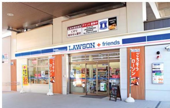
ローソン+フレンズ山陽西新町店

山陽フレンズでは、明石駅前に「ローソン+フレンズ 明石駅前店」を、西新町駅高架下に「ローソン+フレンズ 山陽西新町店」を新たにオープンし、事業の拡大に注力しました。