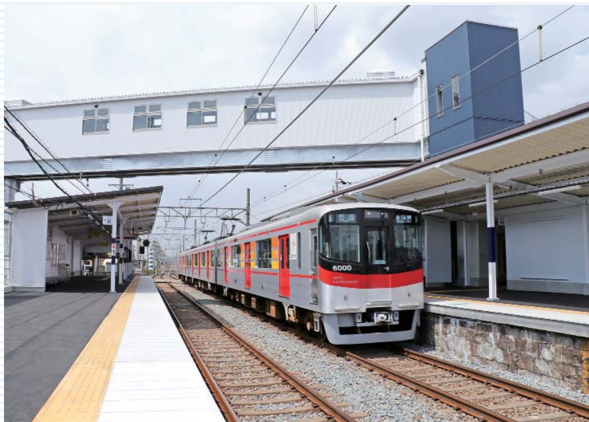
バリアフリー化した江井ヶ島駅