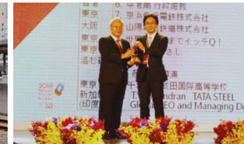
「2018 台湾観光貢献賞」授与式