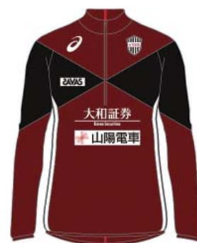
2018シーズンデザイン