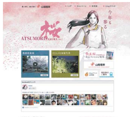
専用サイトトップページイメージ

＜資料提供先＞ 青灯クラブ、近畿電鉄記者クラブ、兵庫県政記者クラブ、神戸市政記者クラブ、神戸民放記者クラブ、神戸経済記者クラブ、明石市政記者クラブ、姫路市政記者クラブ