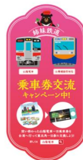
<乗車券交流ステッカー>