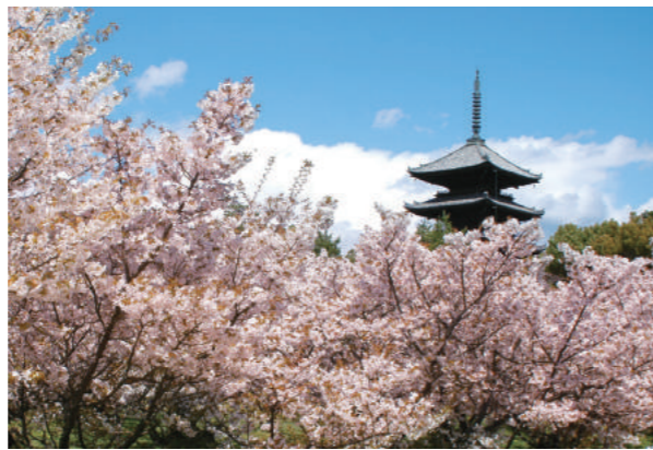
Ninna-ji Temple 仁和寺 님나지 절

Tickets can be purchased and used from March 3 (Fri.) to May 28 (Sun.) 2017.