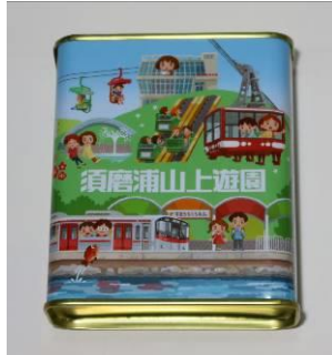
サクマドロップス