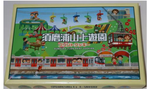
プリントクッキー