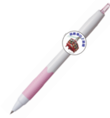
ジェットストリーム