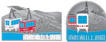
鉢伏山ピンバッジ