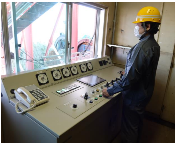
新しく自動化した制御装置（ロープウェイ運転装置）