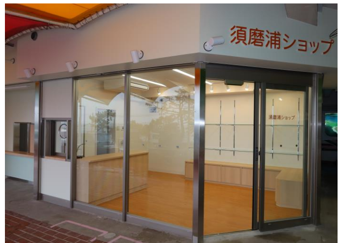
美装化した山麓側売店