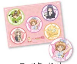
コースターセット