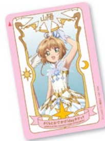
さくらとおでかけ1dayチケット

山陽電車全線(西代～山陽姫路・山陽網干)が1日乗り降り自由、さらに須磨浦ロープウェイ・カーレーターも往復乗車可能な1dayチケットを発売いたします。通常料金2,820円のところ、1,200円でご利用いただけるほか、「カードキャプターさくら」のデザインをお楽しみいただけます。