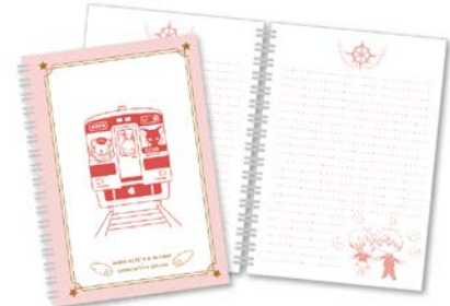
ラリーコンプリート賞 オリジナルグッズ