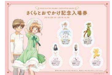
さくらとおでかけ記念入場券