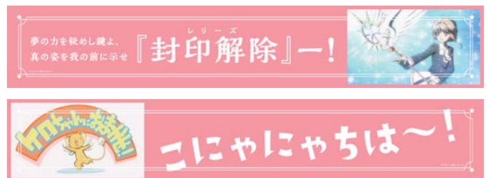
窓上額面イメージ

※運行期間中、不定期で西代駅・山陽百貨店などに「ケロちゃん」「スッピー」「モモ」が登場します。山陽電車でおでかけの際には、是非会いに行ってみてください。