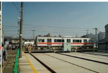
トラバース走行実演