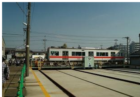
トラバーサー走行実演