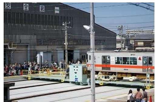
トラバーサー走行実演