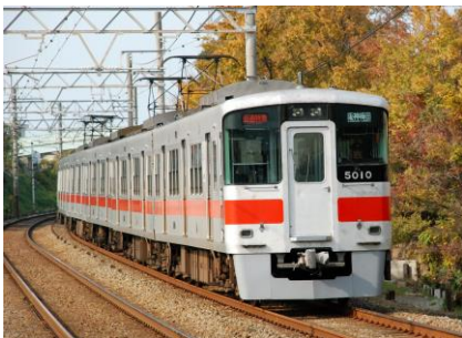
山陽電車直通特急

大人1人の往復乗車券（1,580円）と須磨浦山上遊園Bコース利用券（1,200円）をあわせた通常料金2,780円を1,500円で、小児1人の往復乗車券（800円）と須磨浦山上遊園Bコース利用券（750円）をあわせた通常料金1,550円が800円で購入できます。