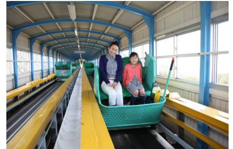
日本で唯一の乗り物「カーレーター」