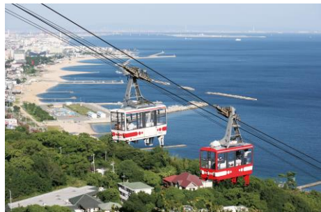
須磨浦ロープウェイ