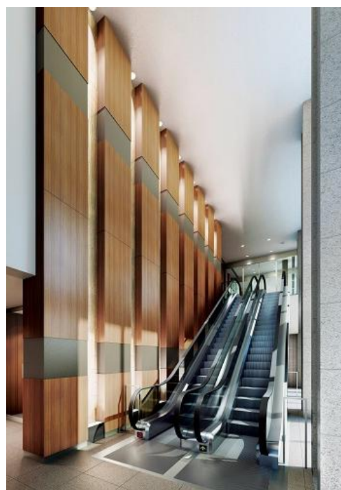
▲グランドエントランス完成予想CG