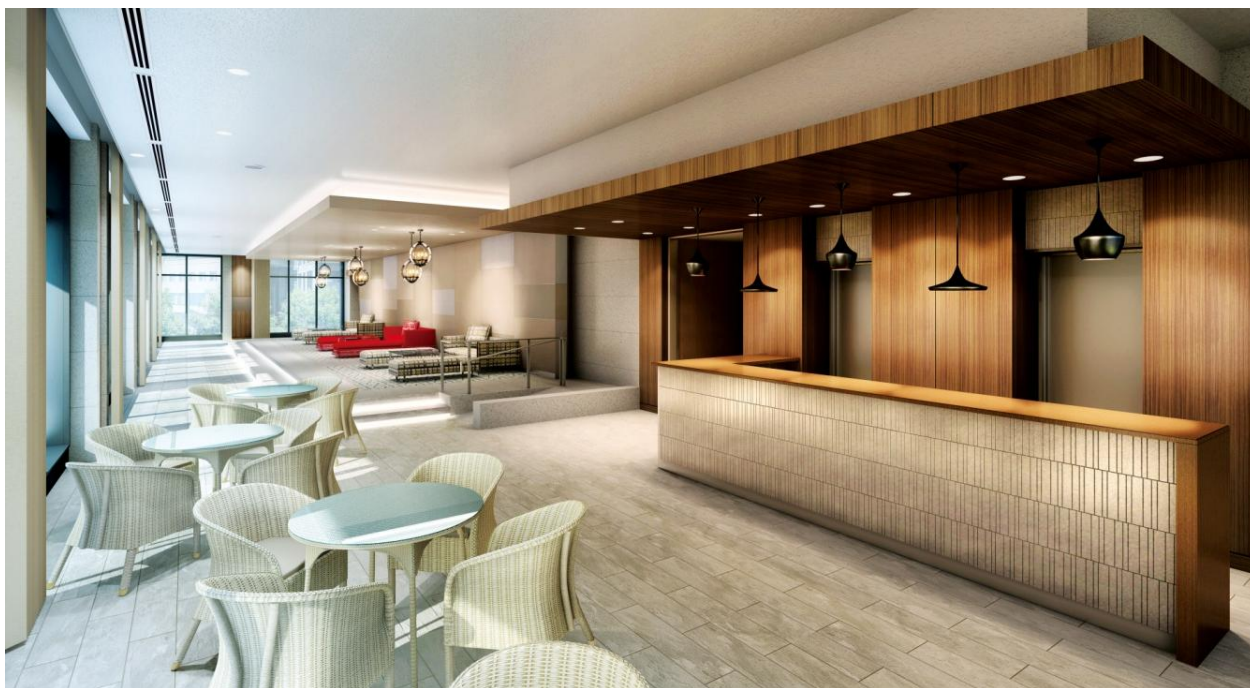
▲オーナーズラウンジ完成予想CG

オーナーズラウンジ、ビューラウンジ、ゲストルーム、キッズルーム、エスカレーターウォールのデザイン 及び家具等をコーディネート。