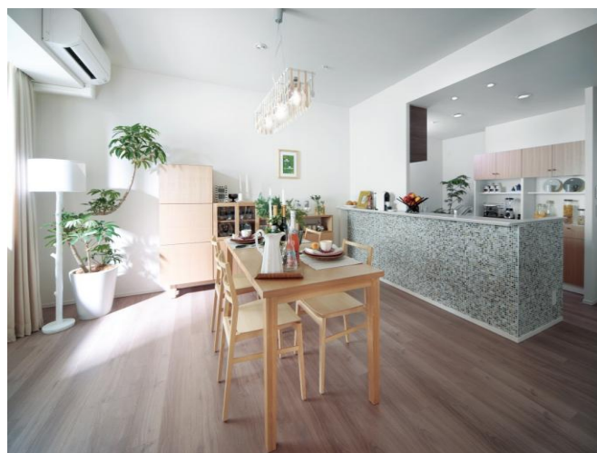
▲SHタイプモデルルーム

(2) SHタイプ(2LDK/90.28㎡) ホワイトアッシュで統一された家具で、 洗練された空間。