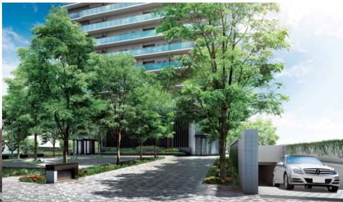
▲ガーデンテラス完成予想CG