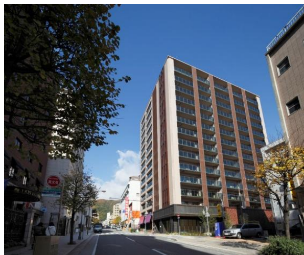
▲「ザ・パークハウス 神戸トアロード」外観写真 (2012年10月竣工済)

神戸市中央区中山手通2丁目の総戸数91戸からなる神戸市内では初めての「The SAZABY LEAGUE」コラボレーションマンション。モデルルームは「The SAZABY LEAGUE」のファッションブランド『エストネーション』が「大人の洗練された暮らし」をテーマにフルコーディネートしました。