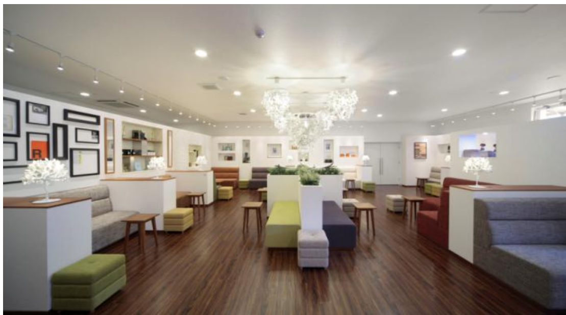
▲レジデンスギャラリー ラウンジ