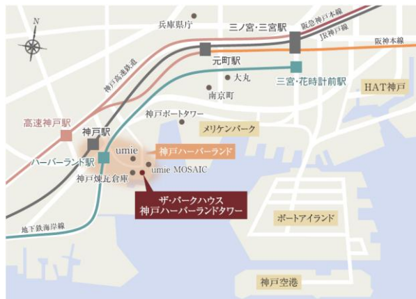
▲周辺エリア概念図