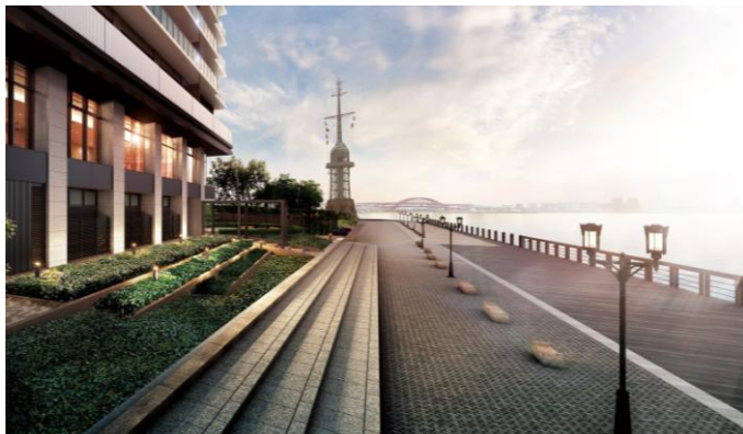
▲ハーバービューテラス完成予想CG