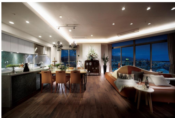
▲PFタイプモデルルーム

(1) PFタイプ(2LDK/144.04㎡) チーク材とステンレスのコンビネーション、 ロンドンアンティーク家具をレイアウトした 大人の感性が薫る住まい。