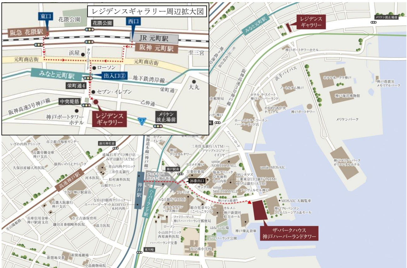
▲現地・レジデンスギャラリー案内図

物件URL： http://www.mecsumai.com/tph-kobeharbor/