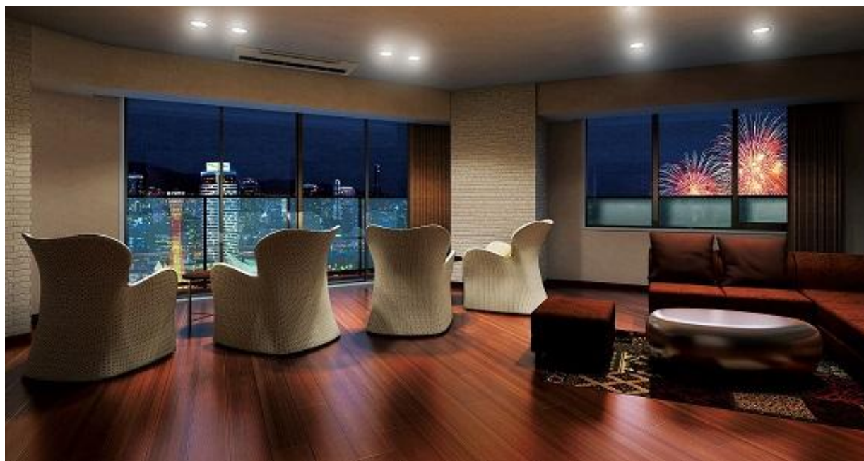
▲ビューラウンジ完成予想CG