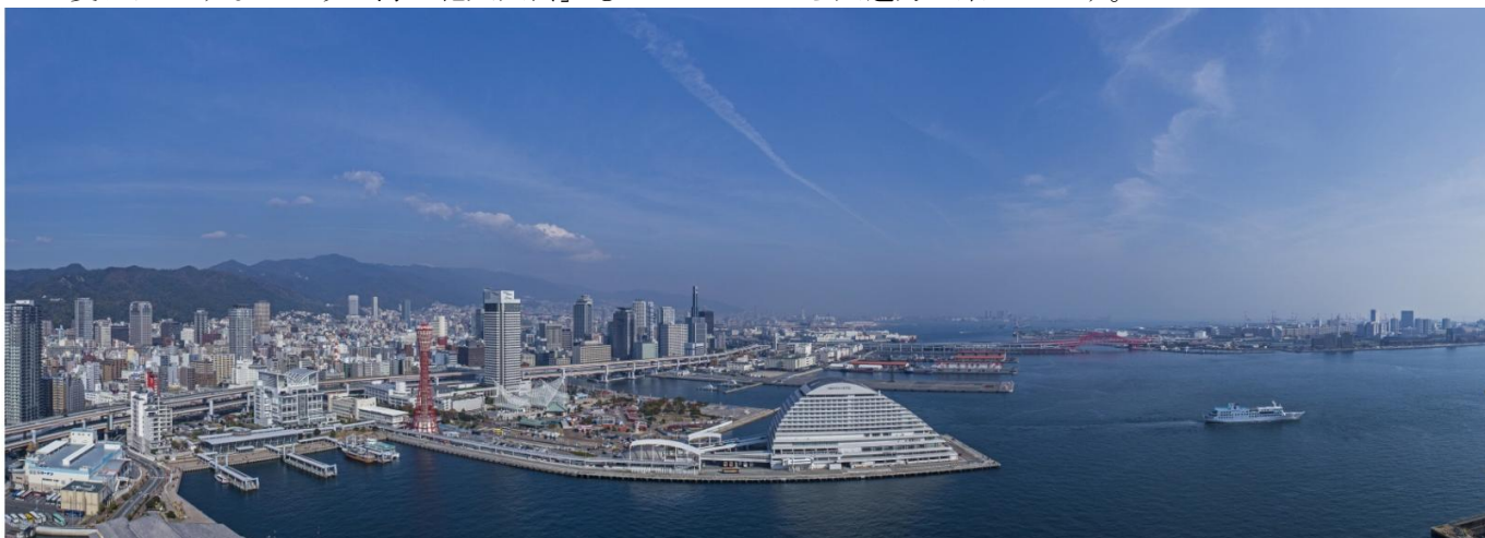
▲現地からの東方面眺望写真（36階相当）