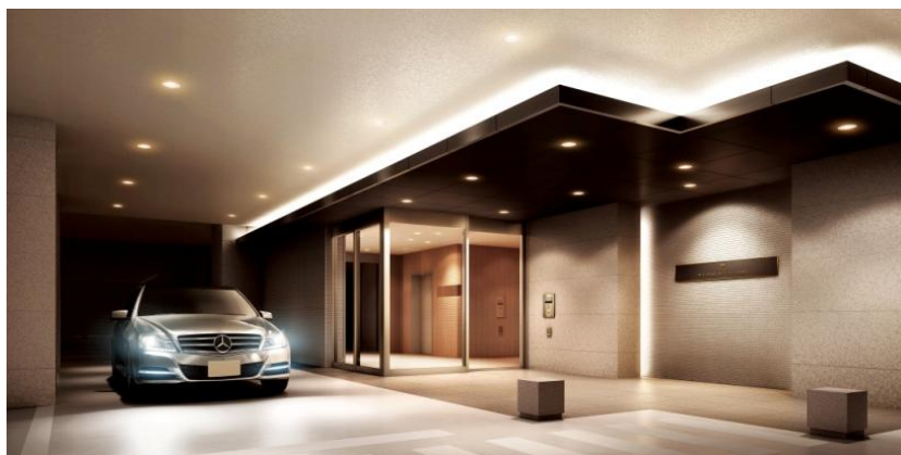
▲コーチエントランス（車寄せ）完成予想CG