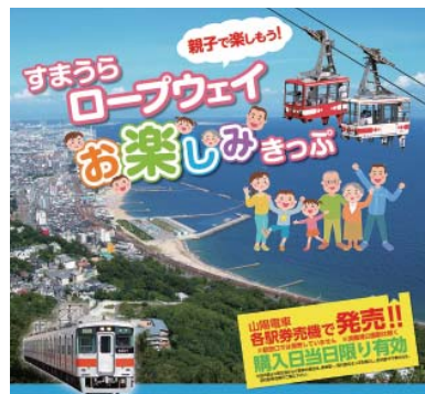
すまうらロープウェイお楽しみきっぷ

レジャー・サービス業におきましては、山上から瀬戸内の大パノラマを一望できる須磨浦山上遊園で、鉄道と連携した企画乗車券「すまうらロープウェイお楽しみきっぷ」を新たに発売したほか、ご家族連れがお楽しみいただける各種イベントを開催するなど、行楽客の誘致に努めました。また、舞子ホテルでは、旬の食材を活かしたイタリアンを提供し、新たな顧客の掘り起こしをはかったほか、大正年間創建の邸宅での趣あるウェディングプランを積極的にPRいたしました。