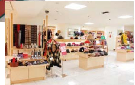
山陽百貨店1階 婦人雑貨売場