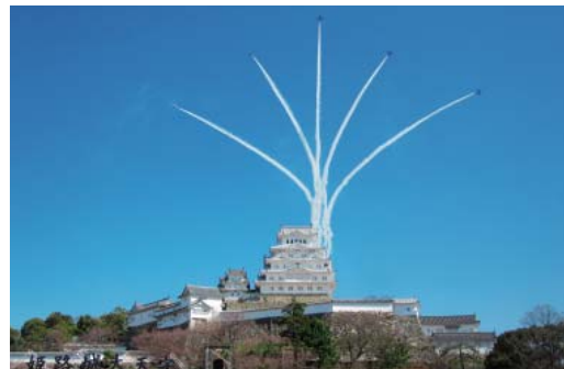
世界文化遺産・姫路城

運輸業全体の営業収益につきましては、姫路城のグランドオープンにより行楽客が増加したことに加え、昨年は消費税率引き上げによる先買い需要の反動減があったことなどから、前年同期に比し4.4%増の9,660百万円となりました。