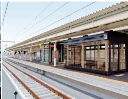
新しい西新町駅ホーム