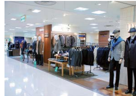
山陽百貨店4階 紳士服売場

流通業全体の営業収益につきましては、昨年4月の消費税率引き上げ前の駆け込み需要による大幅増の反動などにより、前年同期に比し2.0%減の9,947百万円となりました。