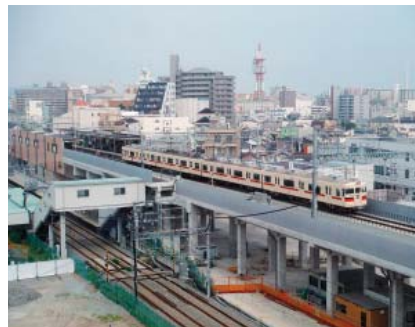
高架化された西新町駅