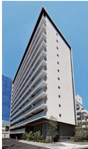
エス・キュート梅田中崎町

不動産業全体の営業収益につきましては、マンション分譲の規模の差により、前年同期に比し39.8%増の1,949百万円となりました。