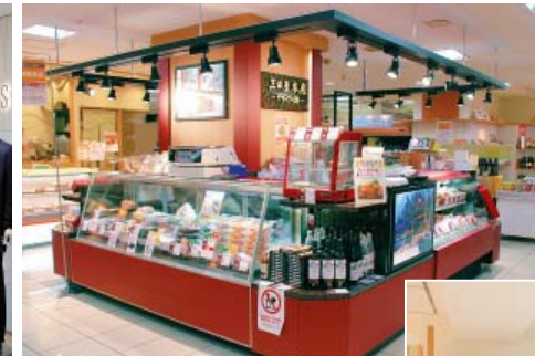
山陽百貨店地階 三田屋本店